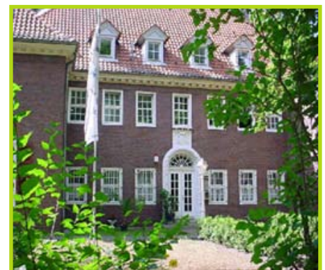
Das Gebäude der Europäischen Führungsakademie in Berlin Marienfelde

Mehr über die Europäische Führungsakademie erfahren Sie im Internet unter www.eu-akademie.de